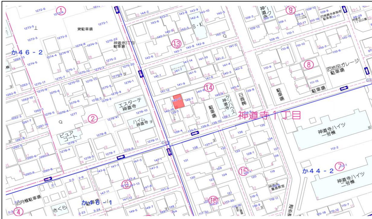
Copyright(C)2024 ZENRIN CO., LTD. Z24CK第179号 Z24CK第180号