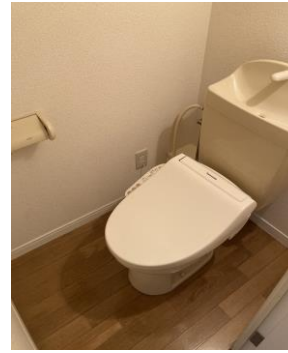
※ 写真は101号室のものです