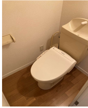
※ 写真は101号室のものです